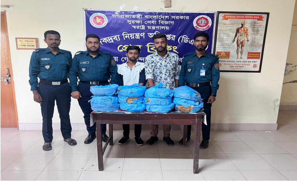
০৫ মার্চ ২০২৪ তারিখ মাদকদ্রব্য নিয়ন্ত্রণ অধিদপ্তর, বিভাগীয় গোয়েন্দা কার্যালয়, বরিশাল কর্তৃক পরিচালিত অভিযানে ২৪ (চকিশ) কেজি গাঁজাসহ গ্রেফতারকৃত ০২ জন আসামী।