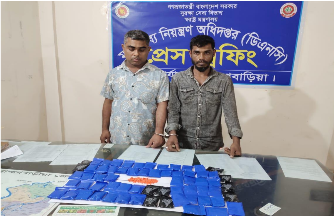
২৮ মার্চ ২০২৪ তারিখ মাদকদ্রব্য নিয়ন্ত্রণ অধিদপ্তর, জেলা কার্যালয়, রাঙ্গামাড়া কর্তৃক পরিচালিত অভিযানে ১৩০০০ (তের হাজার) পিস ইয়াবাসহ গ্রেফতারকৃত ০২ জন আসামী।