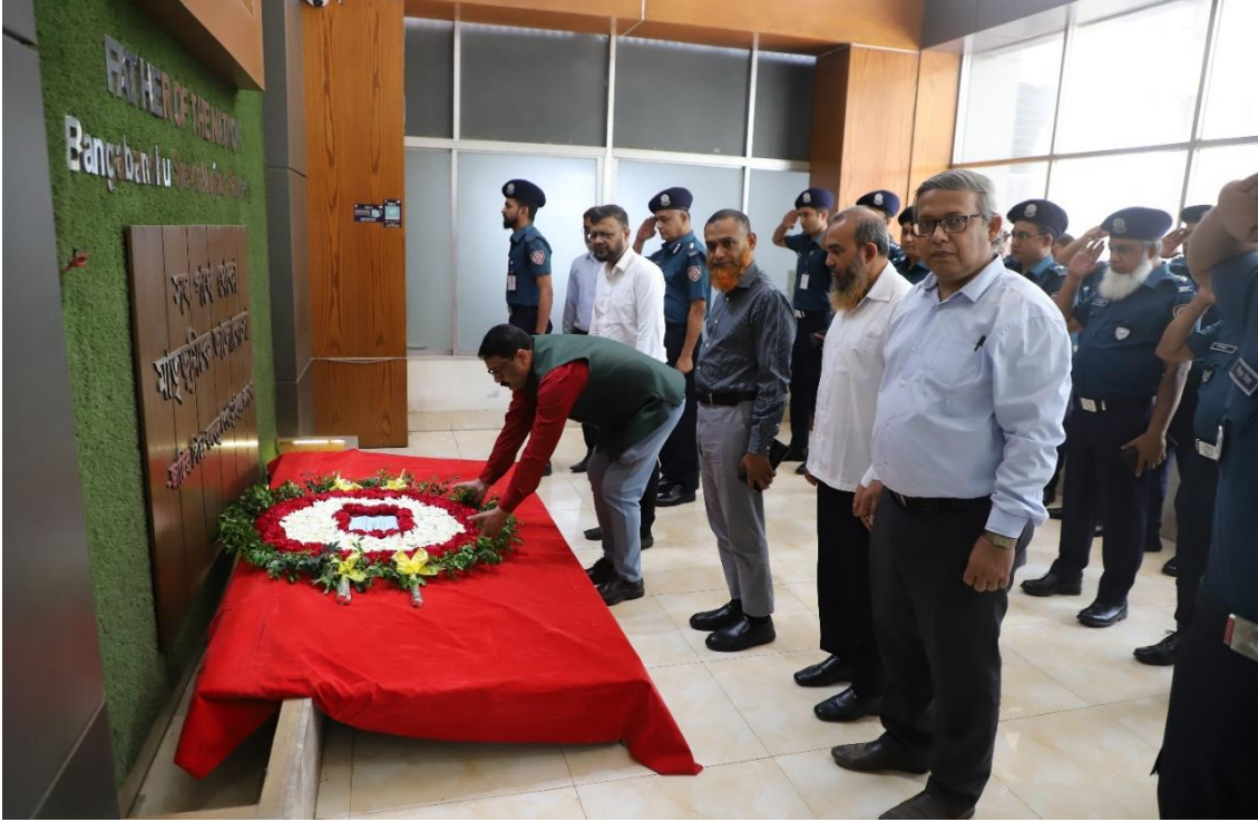
২৬ মার্চ ২০২৪ তারিখে মহান স্বাধীনতা ও জাতীয় দিবস-২০২৪ উদযাপন উপলক্ষ্যে জাতির পিতা বঙ্গবন্ধু শেখ মুজিবুর রহমান ঐর প্রতিকৃতিতে শ্রদ্ধাঞ্জলি।