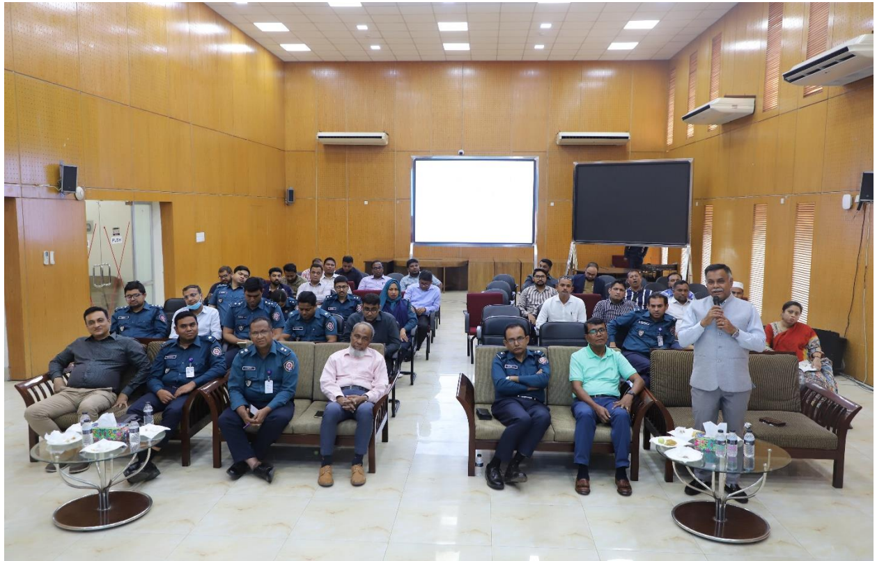
১১ মার্চ ২০২৪ তারিখে অংশীজনের অংশগ্রহণে অবহিতকরণ সভা অনুষ্ঠিত হয়।