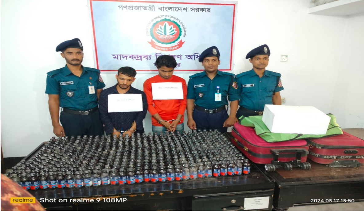
১৭ মার্চ ২০২৪ তারিখে মাদকদ্রব্য নিয়ন্ত্রণ অধিদপ্তর, জেলা কার্যালয়, ফরিদপুর কর্তৃক পরিচালিত অভিযানে ৪৪০ (চারশত চল্লিশ) বোতল ফেন্সিডিলসহ গ্রেফতারকৃত ০২ জন আসামী।