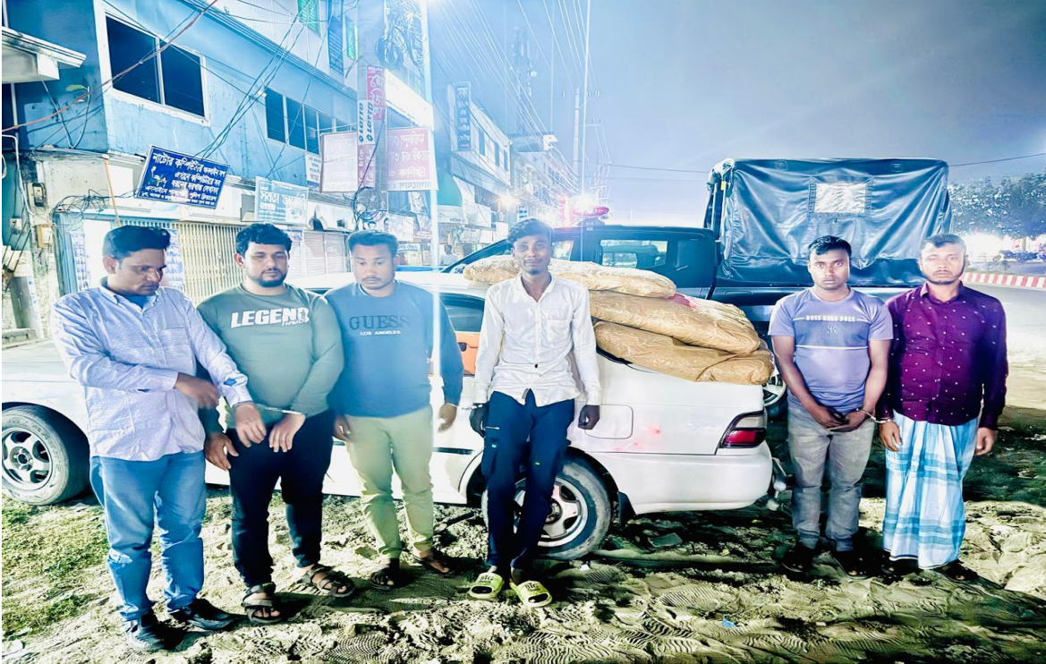
২৩ মার্চ ২০২৪ তারিখে মাদকদ্রব্য নিয়ন্ত্রণ অধিদপ্তর, বিভাগীয় গোয়েন্দা কার্যালয়, রাজশাহী কর্তৃক পরিচালিত অভিযানে ৬০ কেজি গাঁজাসহ গ্রেফতারকৃত ০৬ জন আসামী।