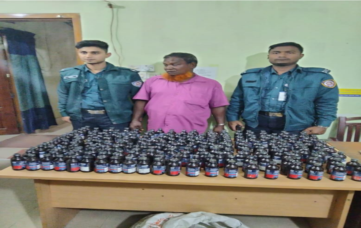
০৩ মার্চ ২০২৪ তারিখ মাদকদ্রব্য নিয়ন্ত্রণ অধিদপ্তর, জেলা কার্যালয় রংপুর কর্তৃক পরিচালিত অভিযানে ২১৫ (দুইশত পনের) বোতল ফেন্সিডিলসহ গ্রেফতারকৃত ০১ জন আসামী।