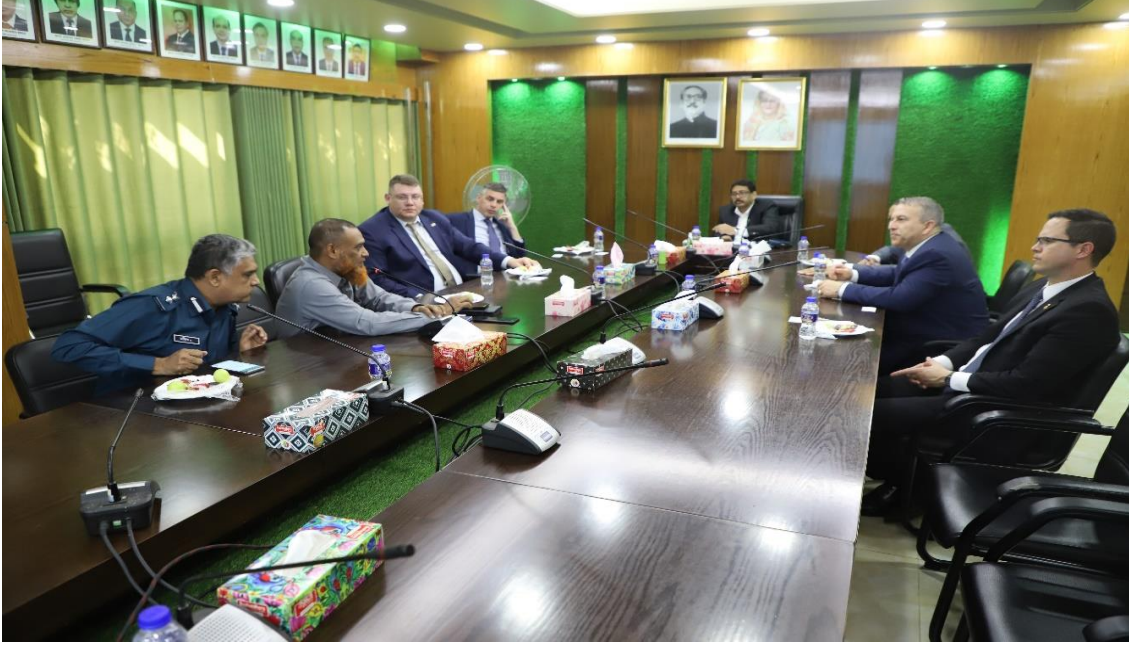
০৪ মার্চ ২০২৪ তারিখ অধিদপ্তরের মহাপরিচালক মহোদয়ের সাথে UNODC প্রতিনিধি দলের মতবিনিময় সভা অনুষ্ঠিত হয়।